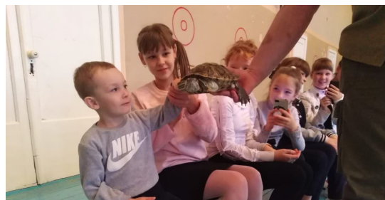
Гостья - черепаха