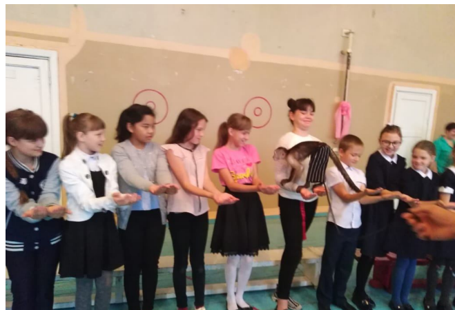
Ребята знакомятся с капуцином

А ещё увидели черепаху, скорпиона, рептилию, питона, крокодила. Да-да!!! Крокодила! Ему 3 года и он длиной 1,5 метра. Демонстрация животных сопровождалась интересным, увлекательным рассказом об их жизни, повадках, особенностях.