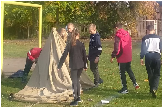
6 и 7 классы ставят палатку

Ребята состязались в умении поставить палатку, переправлялись через болото, выясняли кто самый меткий в игре дартс, составляли пословицы, учились оказывать медицинскую помощь, определяли топографические знаки... Это далеко не все испытания, которые ребята с успехом преодолели!