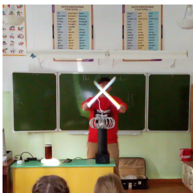
Светящиеся мечи и очки. Организаторы пытаются удивить зрителей

Ребята преодолели свой страх и потрогали электрический ток в перчатках Таноса. Увиденное, конечно,