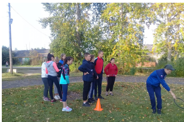
8 класс проходит испытание «Болото»