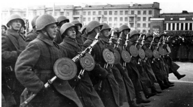
Парад 7 ноября 1941 г. на Красной площади