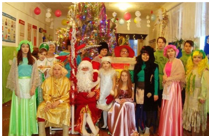
Артисты новогоднего спектакля