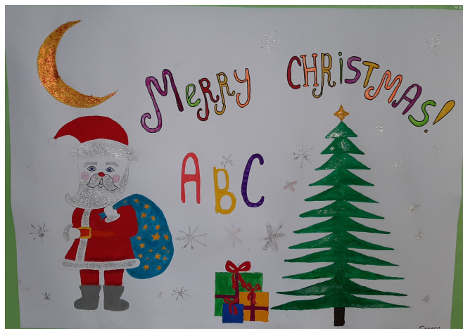
Пятиклассники очень постарались и представили свой вариант новогоднего плаката с буквами английского алфавита

Целью проведения недели иностранных языков было совершенствование речевой компетенции обучающихся по всем видам речевой деятельности, практическое применение полученных умений и навыков для решения творческих задач, формирование творческой активности и творческого мышления обучающихся, а также знакомство с обычаями и традициями стран изучаемых языков.