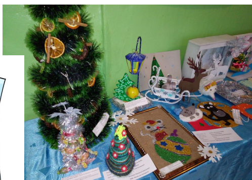
Ребята представили свои работы на школьной выставке «Новый год»