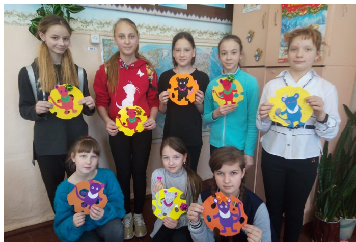
Смастерили символ 2020 года - мышку

Четверг был посвящён новогоднему мастер-классу. На уроках технологии в 5 и 6 классах под руководством педагога обучающиеся изготавливали из фетра символ 2020 года - мышонка. Было очень увлекательно и не так сложно, как могло показаться на первый взгляд.