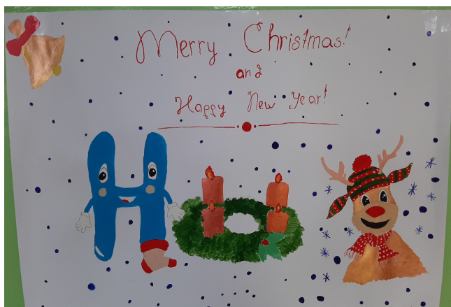
Плакат от авторской группы 6 класса

К неделе был составлен план работы, который включал различные виды деятельности. Были подготовлены и проведены следующие мероприятия: