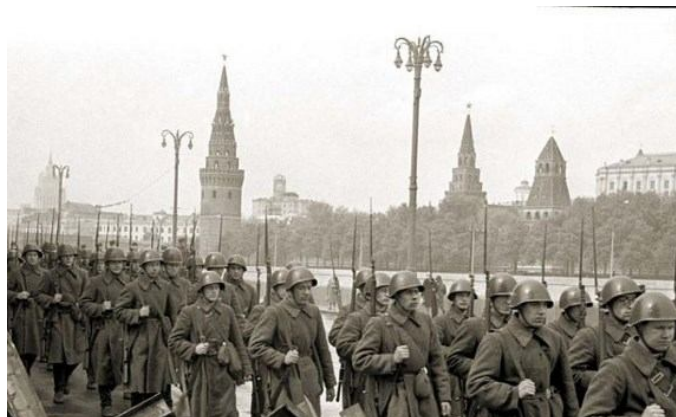
С Красной площади бойцы уходили прямо на фронт

На станции «Визитная карточка» команды представляли свое название и девиз, приветствовали соперников. На «Тропе Робинзона» делились знаниями о том, как выживать в условиях дикой природы, как добыть себе пропитание и воду. На станции «ЗОЖ» отвечали на вопросы, связанные со здоровым образом жизни. Определяли каким животным принадлежит гнёзда, раковины, погрызы на станции «Следы животных». На станции «Лаборатория» участники игры демонстрировали