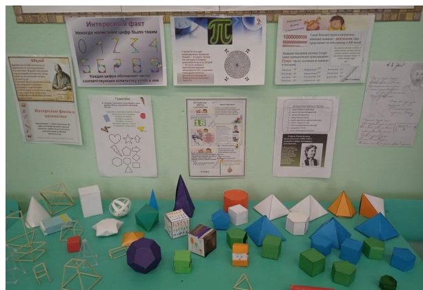
Геометрические фигуры, сделанные руками ребят

Каждый класс выпустил плакат с интересными фактами о математике. Плакаты получились красочные и интересные, их разместили на стенде в кабинете математики.