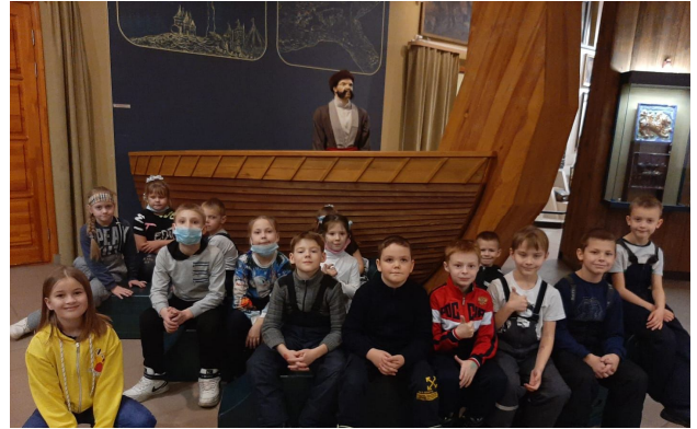
Экскурсия в Свердловском областном краеведческом музее

Ребята поблагодарили пирата за увлекательное путешествие и направились домой уставшие, но безумно удовлетворённые экскурсией. Все поездкой остались довольны, получили заряд новых впечатлений, позитива и энергии.