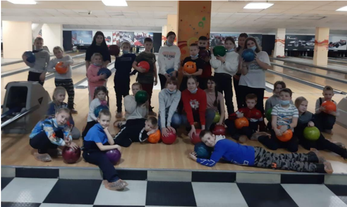
В боулинге ребята отлично провели время

Игровая образовательная экскурсия «Сокровища Урала», подготовленная экскурсионным агентством «Горизонт событий», прошла в формате квеста, в котором дети отправились на поиск заветного клада с