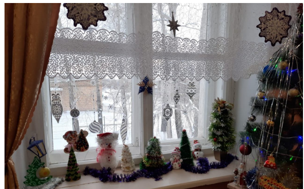
Творческие работы второклассников

видеопоздравление. В канун праздника видеоролики были выложены на странице школьного сообщества в социальной сети Вконтакте.