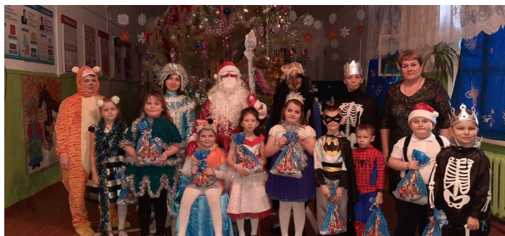
Самые юные школьники – первоклассники на новогоднем празднике

• По китайскому календарю, 2022 - это год Тигра, Китайский Новый год наступает 1 февраля. Традиционно праздничные гуляния длятся 16 дней. Новый Год в Китае – главное торжество и прекрасный повод собраться всей семьей.