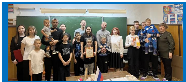
Общее фото участников