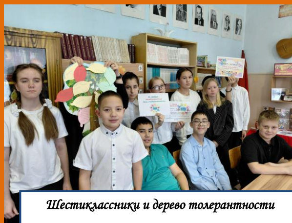
Шестиклассники и дерево толерантности

В нашей школе для учеников 6 класса состоялась игра "Толерантность". Ребята узнали о том, что такое толерантность, какими качествами должен обладать толерантный человек. А также разобрали ситуации, в которых проявляются разные качества человека, поучаствовали в играх и провели мини-исследование "Цвет глаз".