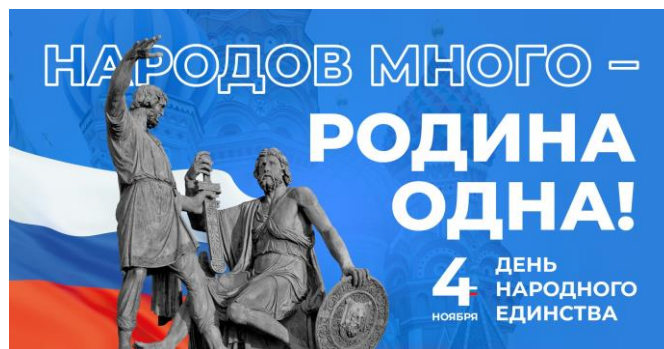
Памятник К.Минину и Д.Пожарскому

К осени 1612 года ополченцы сумели освободить Москву от польских захватчиков. Этот триумф стал