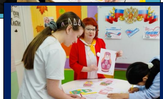
5 и 6 классы выполняют задания