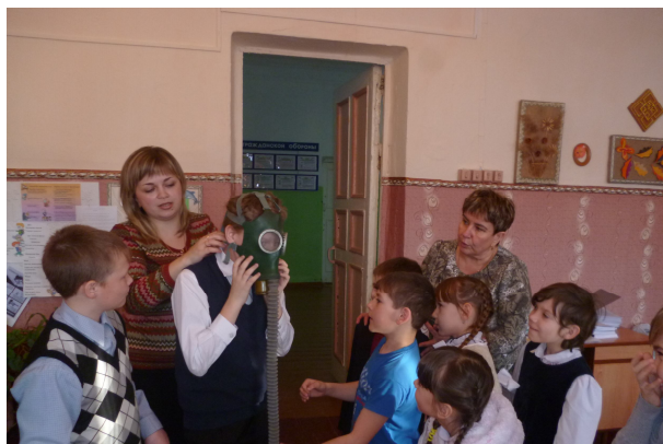
Учатся обращаться с противогазом. Примерка

Между выполнением заданий мальчики бегали по заданному маршруту и искали спрятанные заранее мины. Выполнение этого задания вызвало море эмоций, ведь нужно было не только найти мину, но и сделать это быстро и тихо, ведь присуждался дополнительный балл за дисциплину. После подсчета баллов стало понятно, что наши мальчики самые смелые, спортивные и быстрые.