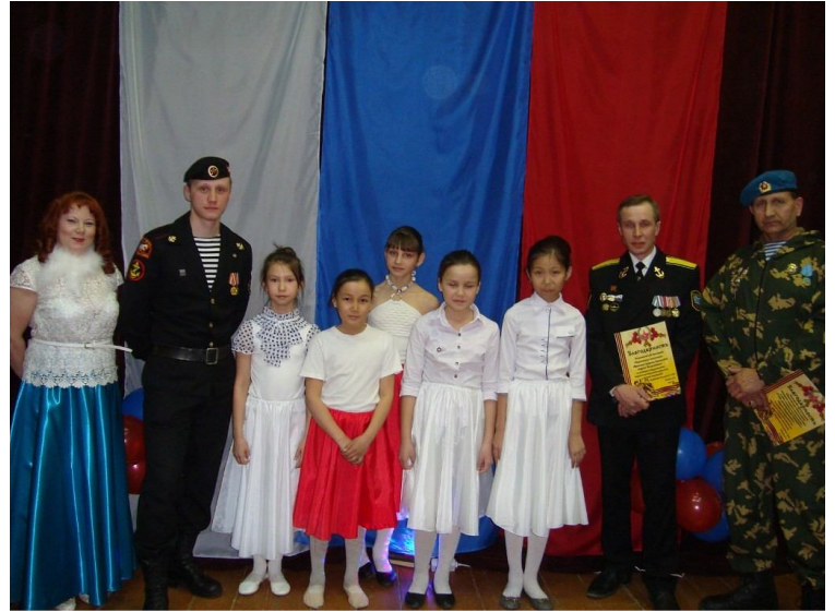
Участники на сцене

гости: военная организация «Воздушно-десантные войска» и организация «Военные моряки». Представители этих организаций выступили с приветственной речью к участникам и зрителям фестиваля.