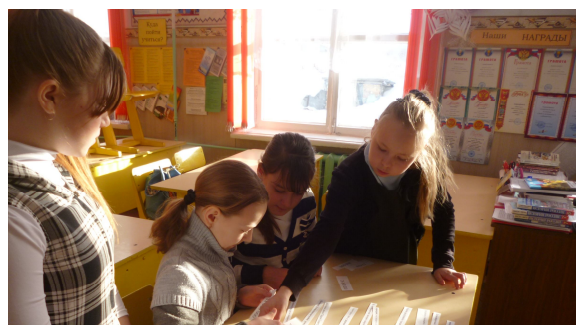
Пятиклассницы участвуют в историческом экспрессе

Сегодня, к сожалению, история Второй Мировой войны переписывается некоторыми странами Европы и Запада. Поэтому особое внимание было уделено заключительному этапу освобождения Советской Армией стран Европы от фашистских захватчиков.