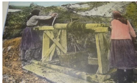
Шах, вручную добывали огнеупорную глину