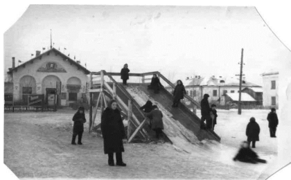
Катание с горки возле Дома культуры