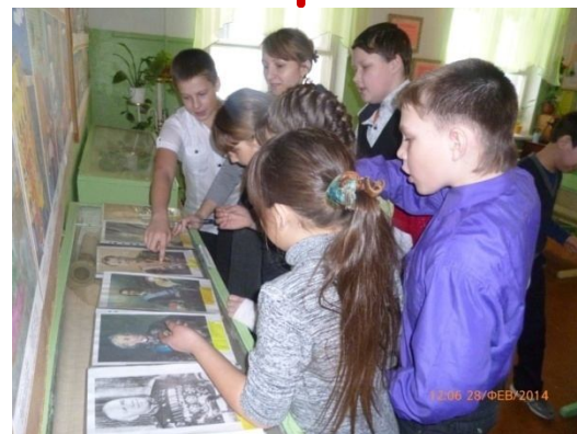
Ребята 5 класса на станции «Историческая личность»

На станции «Историческая личность» учащимся было предложено узнать на портретах и назвать имена семи деятелей истории России. Все классы справились успешно и назвали имена Николая II, Ю.А. Гагарина, Екатерины II, А.В. Суворова, Петра I, Г.К. Жукова, В.И. Ленина.