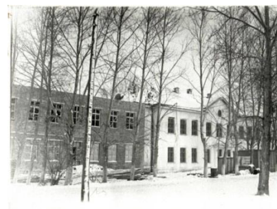
Возведение пристроя к школе