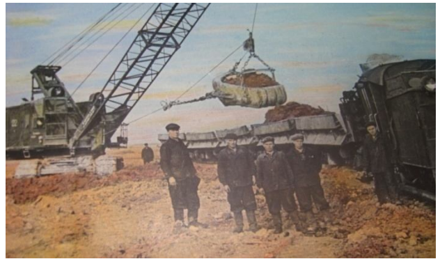
Добыча глины на Полдневском руднике

1. благоприятное экономико – географическое положение (появление железнодорожной