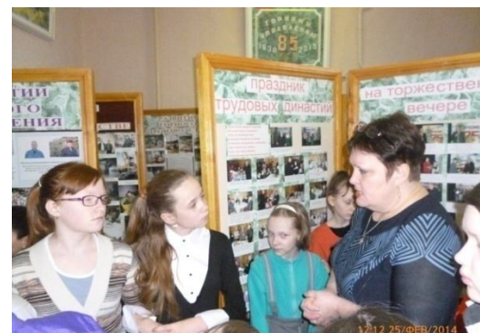
Ребята в Музее Горного Управления прикоснулись к истории родного посёлка